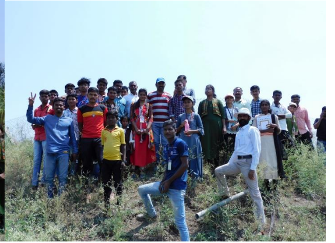
शिवार अभ्यास फेरीत विद्यार्थ्यांनी शेततळ्याची पाहणी केली.