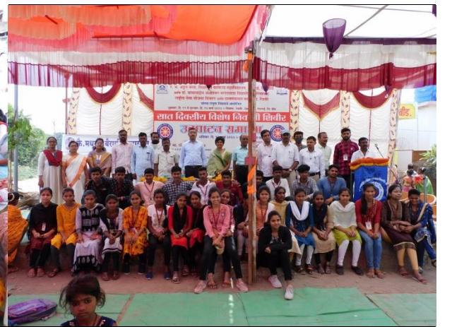
उपस्थित जनसमुदाय.. विद्यार्थी.. शिबिरार्थी.. समूह छायाचित्र..

राष्ट्रीय सेवा योजना हे संस्काराचे विद्यापीठ आहे. राष्ट्रीय सेवा योजनेच्या माध्यमातून विद्यार्थ्यांमध्ये नेतृत्व गुणांचा विकास, व्यक्तिमत्वाचा विकास होत असतानाच ग्रामीण भागातील विविध समस्यांवर विद्यार्थी काम करतात ही अतिशय महत्त्वाची गोष्ट आहे. या माध्यमातून विद्यार्थी संविधान मूल्यांची जोपासना करत