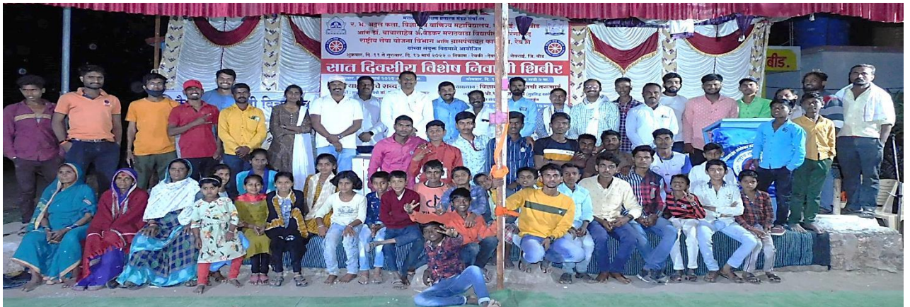
पाहुण्यांसोबत समूह छायाचित्र