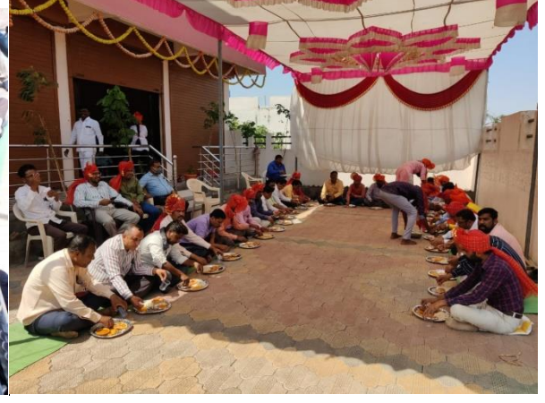
नियमित स्नेह भोजन..