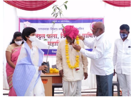
गेवराई येथील र.म. अट्टल महाविद्यालयाच्या वतीने ज्येष्ठांचा रोपटे भेट देऊन सन्मान