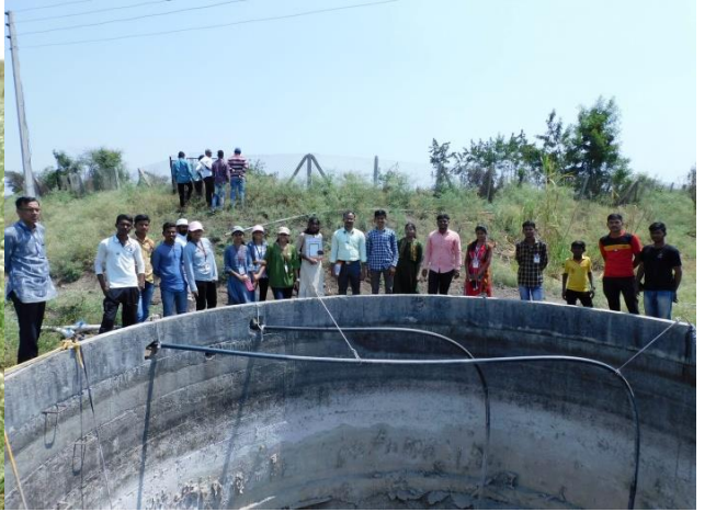
शिवार अभ्यास फेरीत विद्यार्थ्यांनी शेतकऱ्यांशी संवाद साधला..